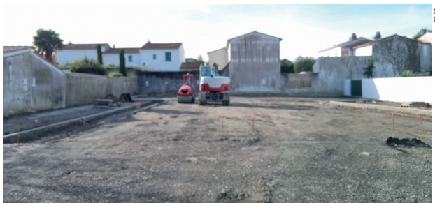
Les travaux de requalification du parking Chauffour sont allés bon train cet automne.

➤ Parking Chauffour : la requalification du parking Chauffour a été achevée avant les fêtes, avec une attention particulière apportée au volet environnemental (verdissage, noues d'évacuation de l'eau de pluie...). Le stationnement des vélos et deux roues y a la part belle, au côté de places pour les voitures.