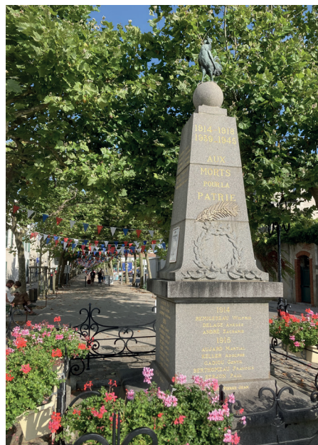
Le monument aux morts de La Flotte et le Cours Félix Faure.

Les rues, le port et les bateaux de La Flotte seront pavés pour cette commémoration, qui rassemblera, au monument aux morts, les anciennes et les jeunes générations. Les personnalités civiles et militaires du département ainsi que des détachements de l'armée de terre, de l'armée de l'air et de l'espace, de la marine nationale et de la gendarmerie, rehausseront cette journée de mémoire.